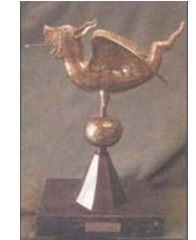
"CITY OF GHENT"