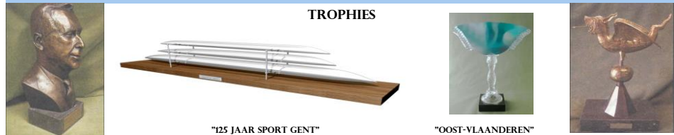
"ROLAND ROMBAUT" "OOST-VLAANDEREN" "CITY OF GHENT"