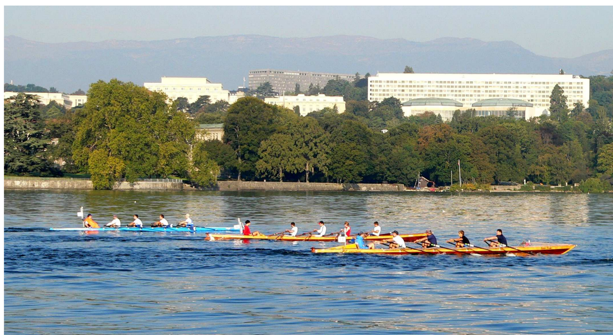
Les participants longeant l'ONU