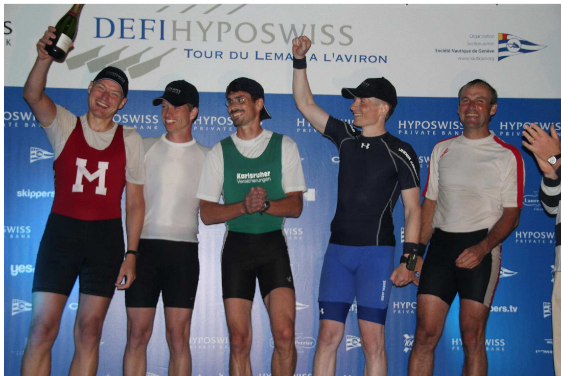
RC HAMM/KARLSRUHER RHEINKLUB ALEMANNIA/ MAINZER RV/STUTTGART-CANNSTATTER